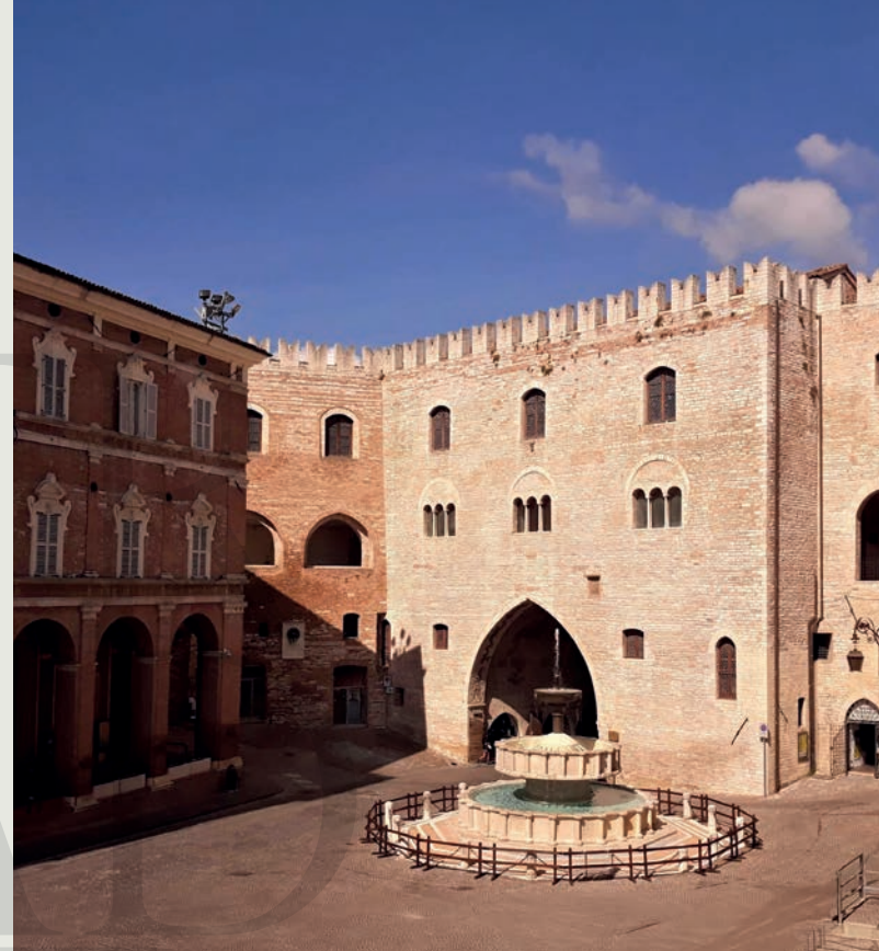
Fabriano città medievale: Palazzo del Podestà e la fontana Sturinalto

In nome della tradizione , il nostro impegno è rivolto alla riscoperta della vocazione spumantistica del territorio di Fabriano , in un perfetto connubio tra storia e territorio. Siamo esclusivamente spumantisti.