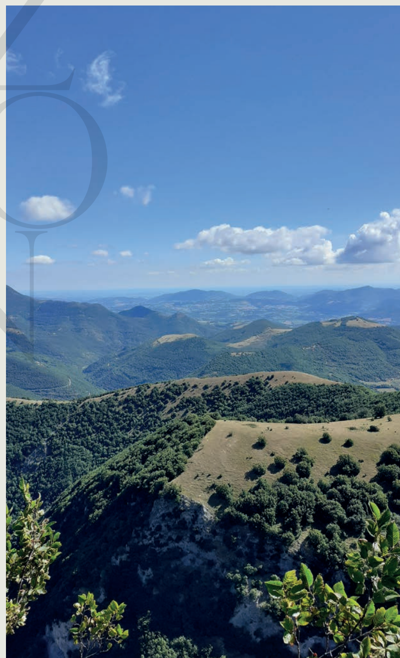
Veduta dal Monte Cucco

Il nostro territorio si estende all'estremo nord dell'antica conca geologica naturale nota come Sinclinale Camerte , situata nel cuore della Regione Marche. I vigneti, circondati da rilievi, risultano protetti dagli influssi climatici marini , favorendo così un clima di tipo continentale.